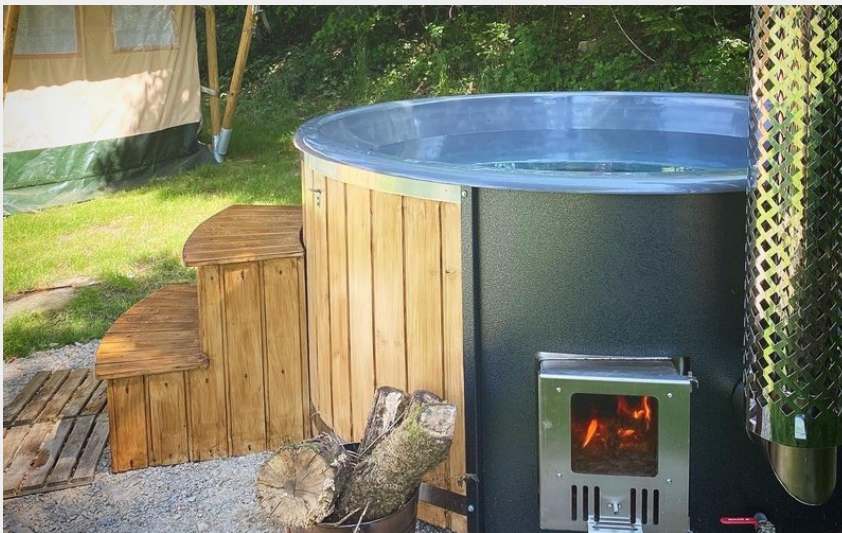
Crédit photo : Camping Le Ranch - tente safari_10 (©Le Ranch Camping)