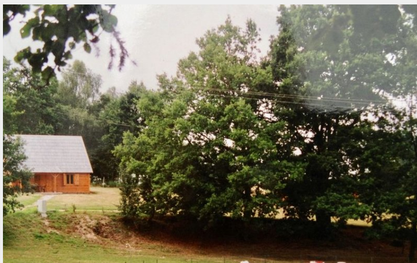
Chalets de l'empereur avec sauna et piscine_1