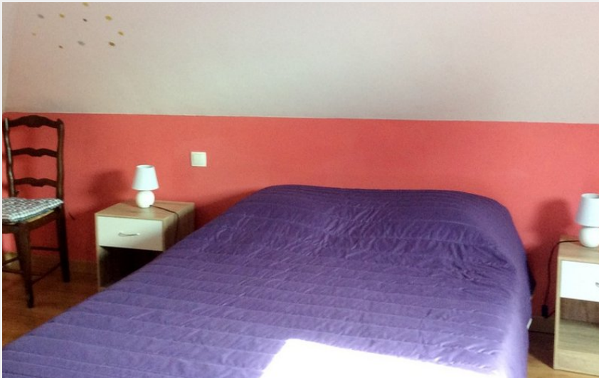
Meublé de Tourisme LAVAUD_10