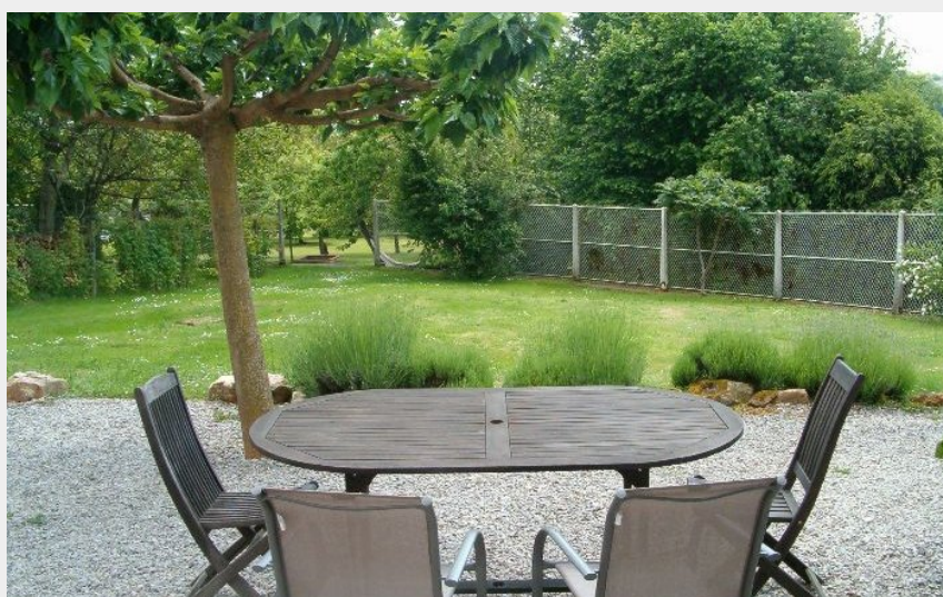
Crédit photo : Le Limaçon - meublé de tourisme KOENEN_5 (P. KOENEN)