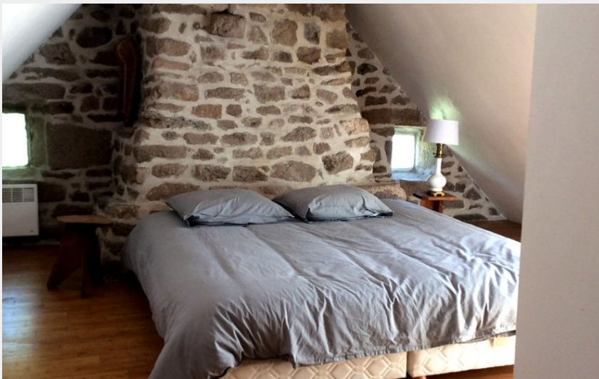
Crédit photo : Gîte FRANCOIS- Domaine de la Monédière_7 (AD / Corrèze Tourisme)