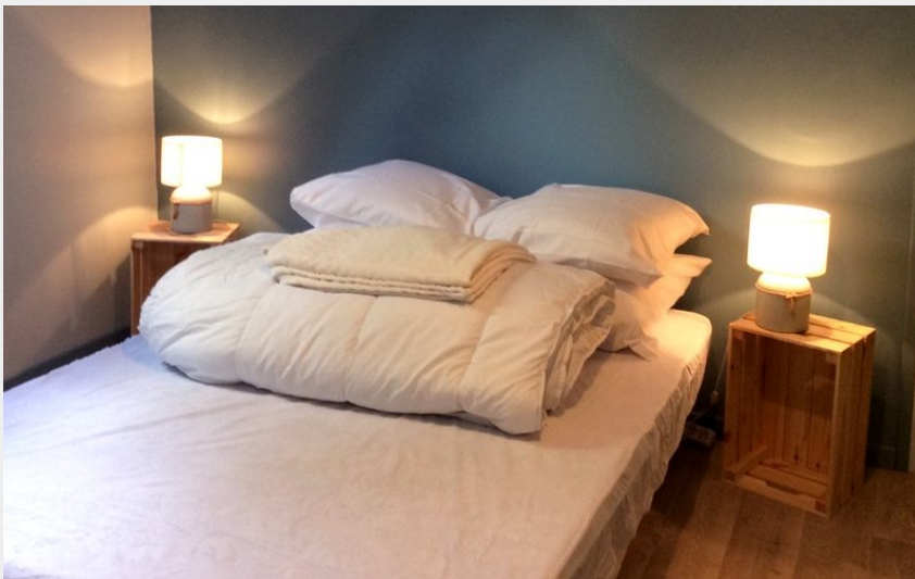
Crédit photo : Meublé de Tourisme BASCOULERGUE_10 (AD / Corrèze Tourisme)