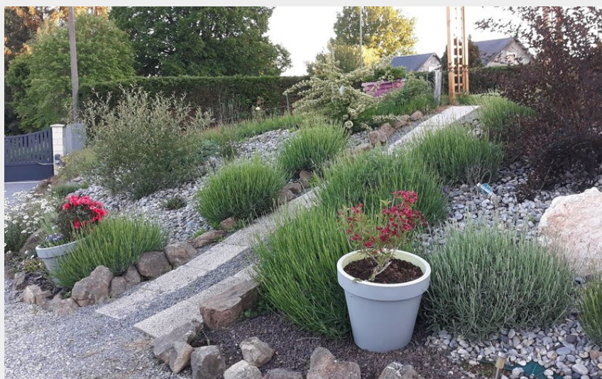
Crédit photo : Chambres d'Hôtes Les p'tits loups Sornac_7 (Les P'tits Loups 7)