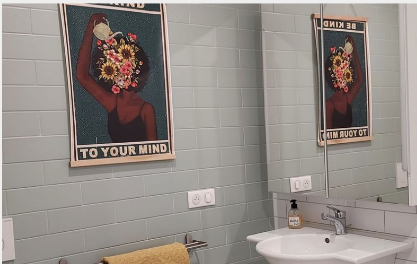
Crédit photo : CH La Marguerite - Condat © C Pouyade (10) (Catherine Pouyade)