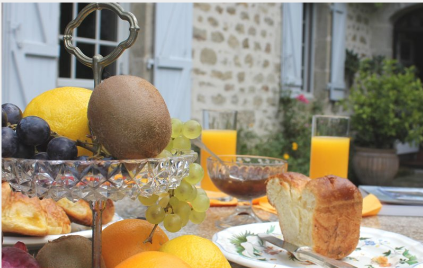
Crédit photo : Chambres d'Hôtes "Au Grand Tilleul"_2 (aubusson felletin tourisme)