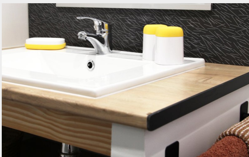
Chambres d'Hôtes "La Maison d'Eole"_7