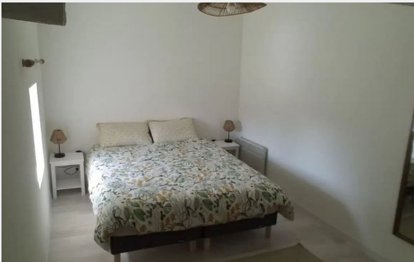
Gîte de la ferme de Chaminadas_7