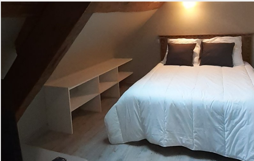
Meublé de Tourisme "Le Cochon qui Fume"_9