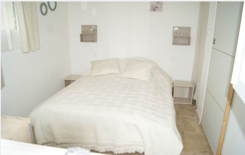
Crédit photo : Village de gîtes Masgrangeas_7 (Association RES-EAU-LAC)