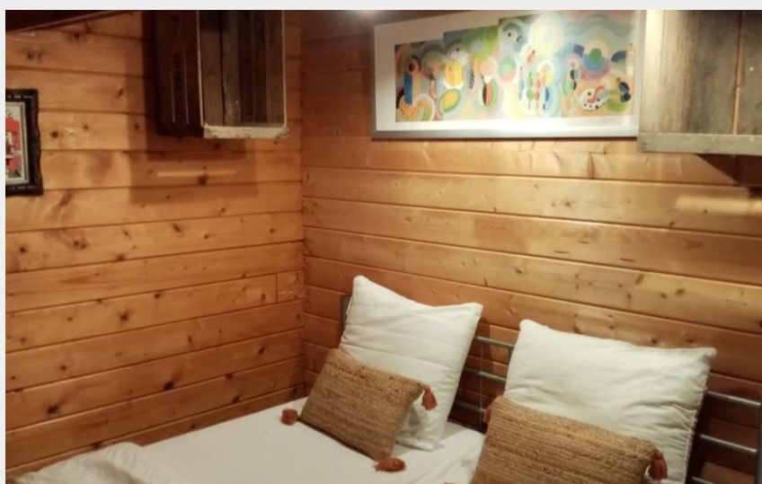
Crédit photo : camping-la-perle-creuse-chalet Mexico-4personnes-chambre double1 (Camping la Perle)