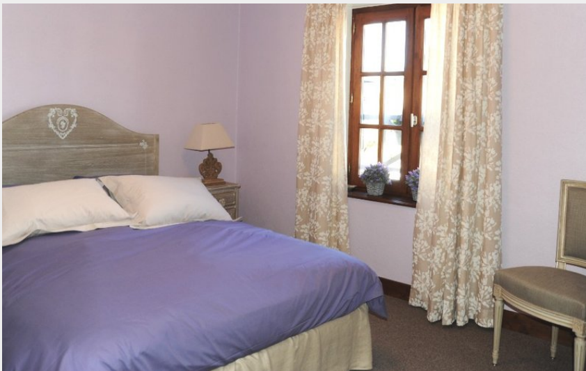
Crédit photo : Hôtel Restaurant La Table de Turlot_4 (©PENIN-COURTET)