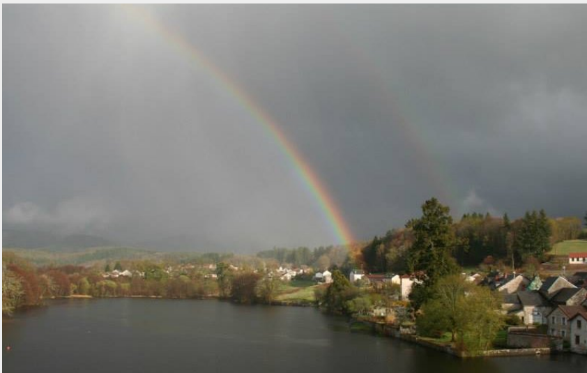
Crédit photo : Hôtel-Restaurant Le Bellerive_3 (Hôtel-Restaurant Le Bellerive)