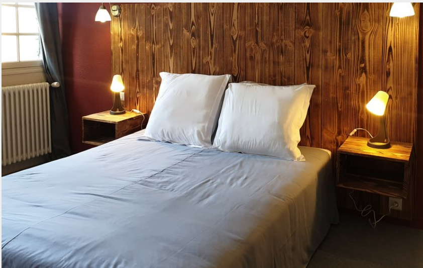
Crédit photo : Chambre Motel (Auberge du Bois de l'Etang Motel les Tilleuls)