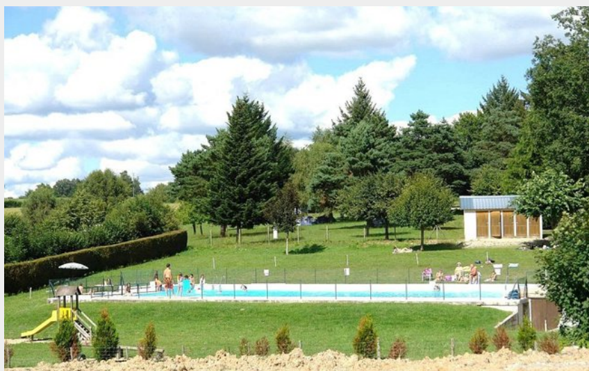
Crédit photo : Camping municipal Pré de la Gane_1 (Camping municipal Pré de la Gane)