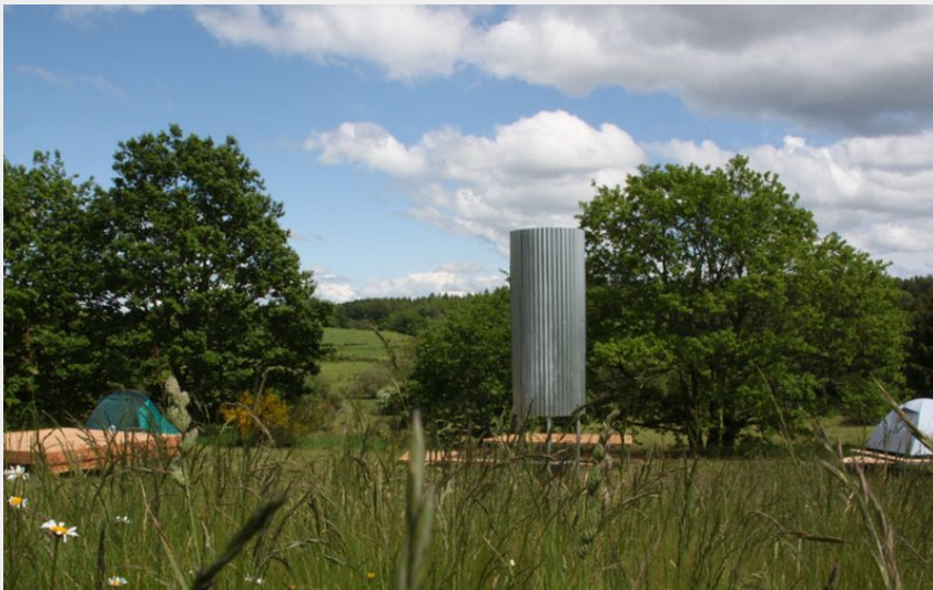
Crédit photo : Aire de bivouac de la Maison du Parc_1 (PNR Millevaches)