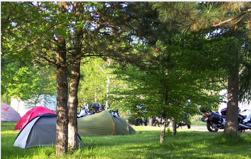
Crédit photo : Camping municipal des Combes_1 (Mairie de Saint-Pantaléon de Lapeau)