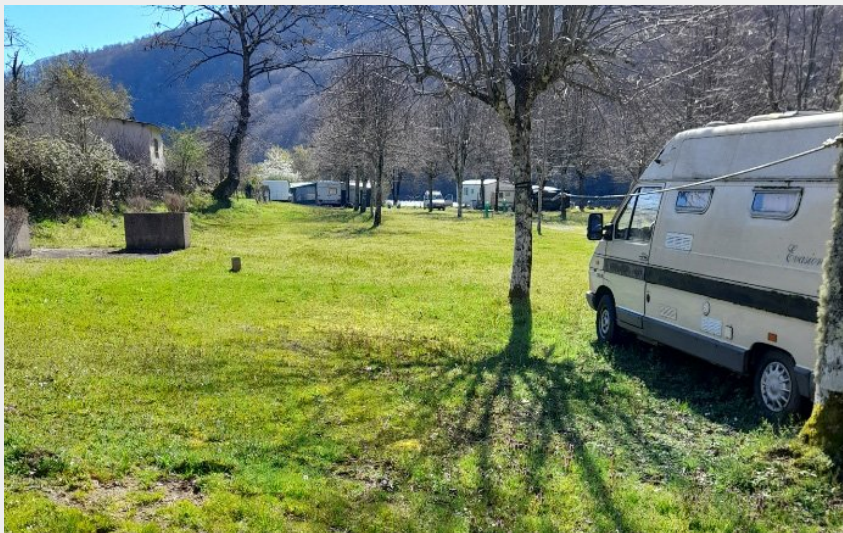
Crédit photo : Camping municipal des lacs de Spontour_1 (Mairie de Soursac)