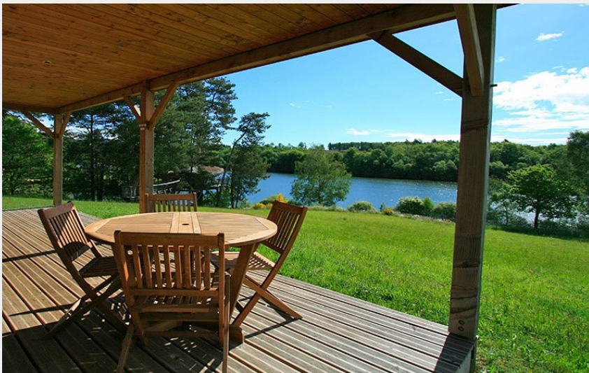
Crédit photo : Vacancéole - Le Domaine des Monédières ****_1 (Vacancéoles)