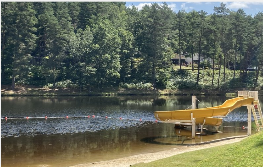
Crédit photo : toboggan et plage surveillée en juillet et aout (Domaine du lac)