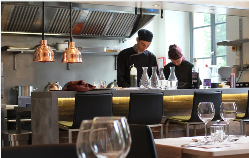
Restaurant "Les Fougères"_1