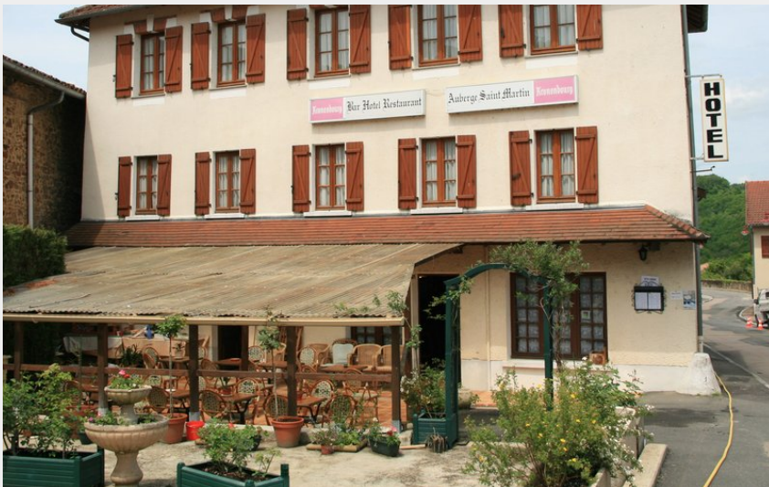
Crédit photo : Restaurant Auberge Saint Martin_1 (Auberge St Martin)