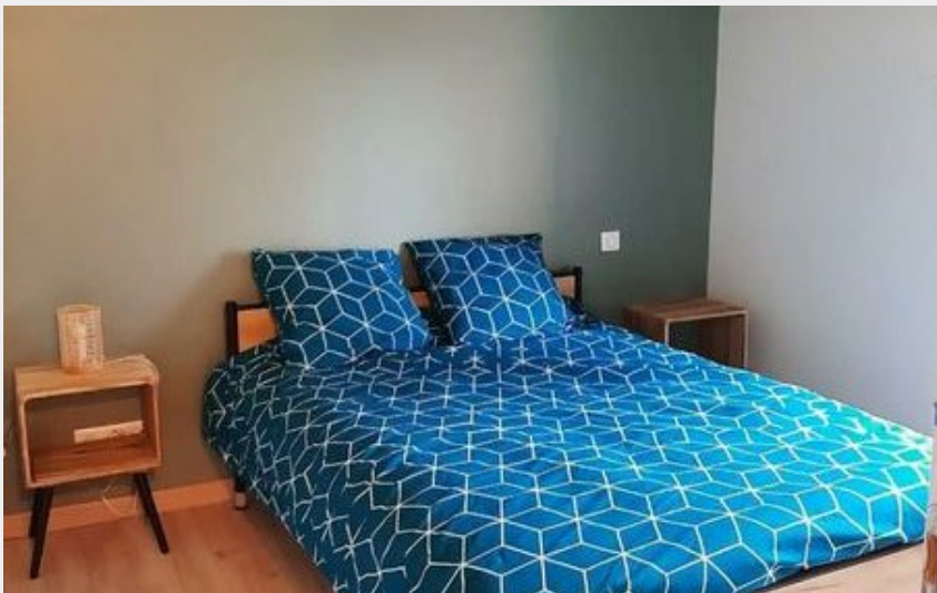
chambre 1 étage - Gîte de Chantergrès