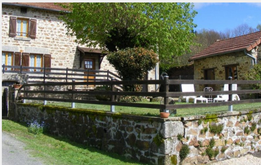
Crédit photo : Maison typique de 1850, entièrement rénovée. (Gîtes de France 23)