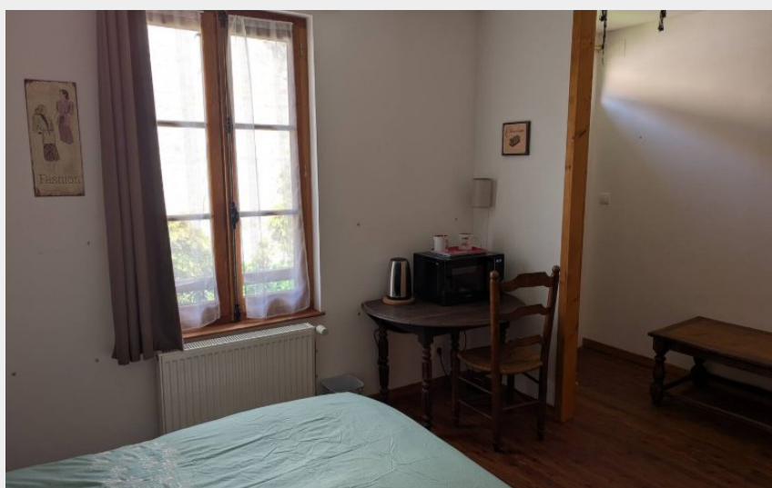
Crédit photo : Chambre 1 avec salle de bain privative et coin repas (OTCSO)