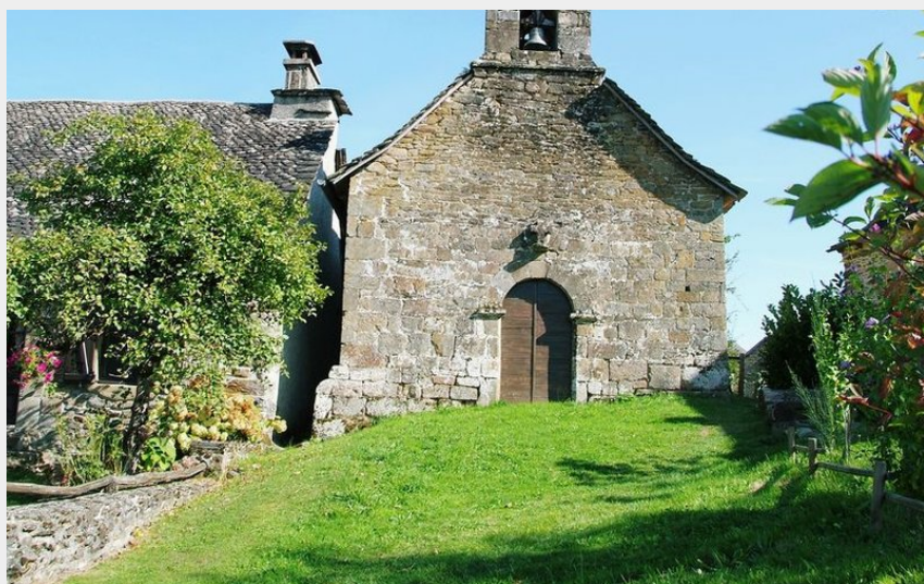
La chapelle Saint-Simon (CC VEM)