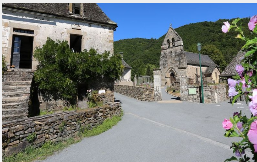
Le Vieux Bourg