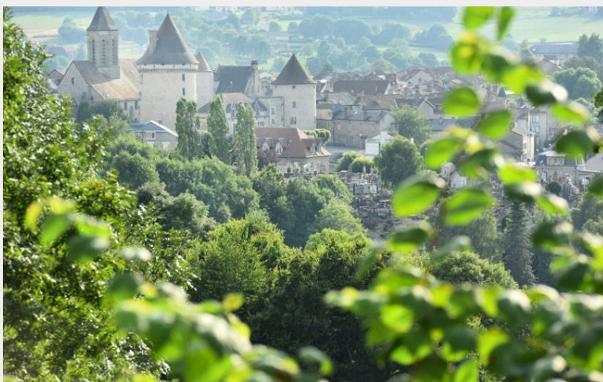
Point de vue sur Bourganeuf

Sud Creuse - Aubusson - lac de Vassivière - Bourganeuf