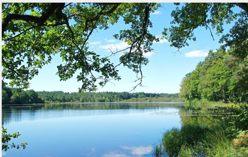
Etang de Gros