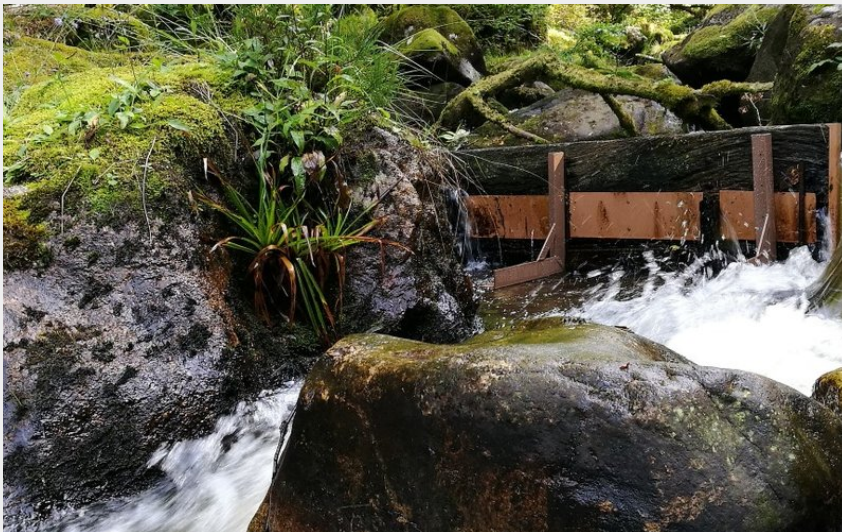
La Rigole du Diable (bsavarypro)

Sud Creuse - Aubusson - lac de Vassivière - Le Monteil-au-Vicomte