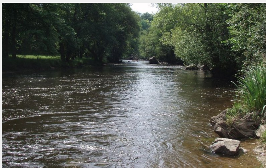
La Vézère