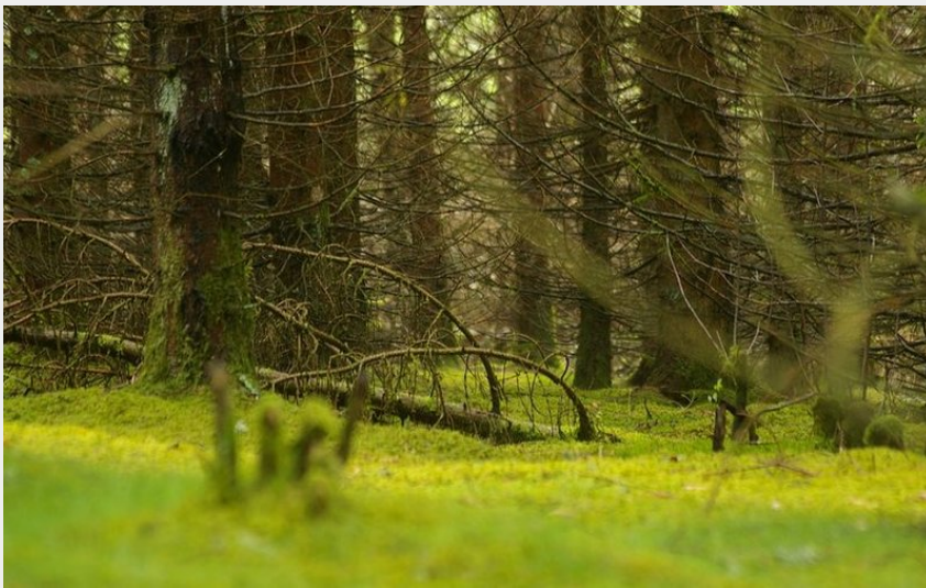
(G.Salat - CC HCC)