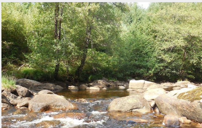
La Vézère