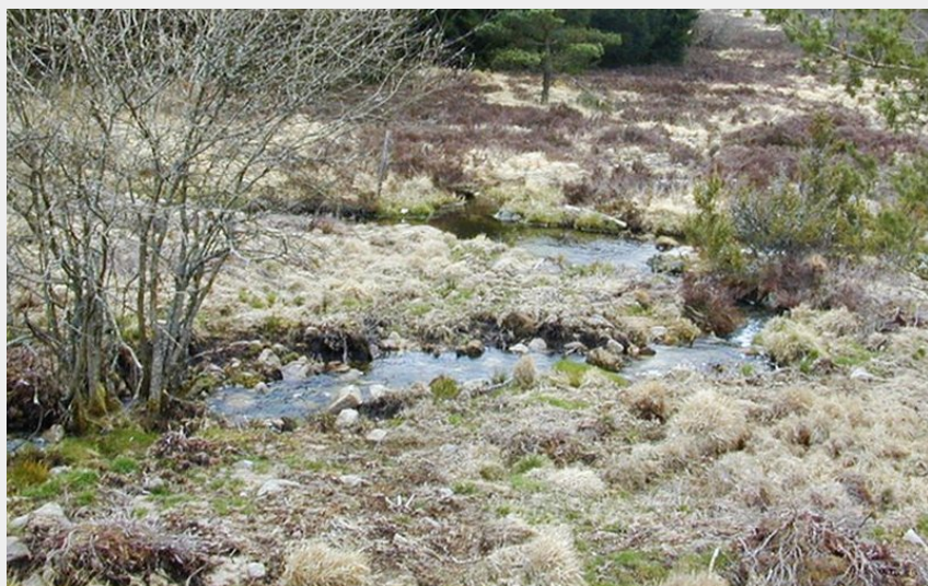
Tourbière (Le Lac de Vassivière)