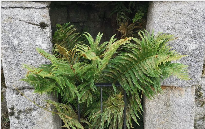
Ancien puits