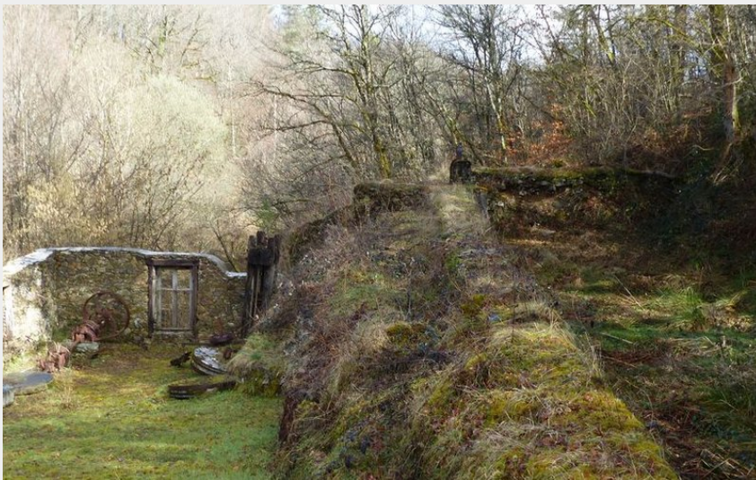
Vestige du moulin de Saint-Hilaire et sa retenue