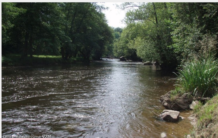
Office de tourisme V2M La Vézère (office de tourisme V2M)