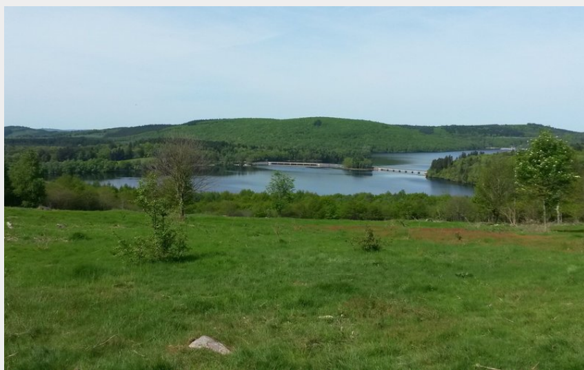
Presqu'île de Chassagnas (OT Lac de Vassivière)