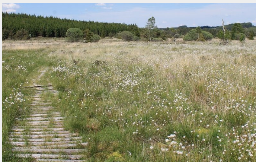
Sur le sentier des linaigrettes