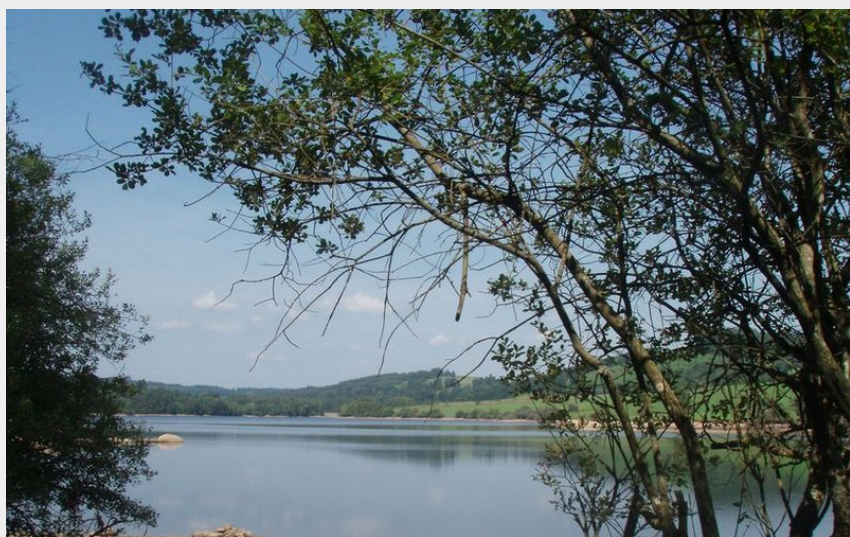
(G.Salat - CC HCC)