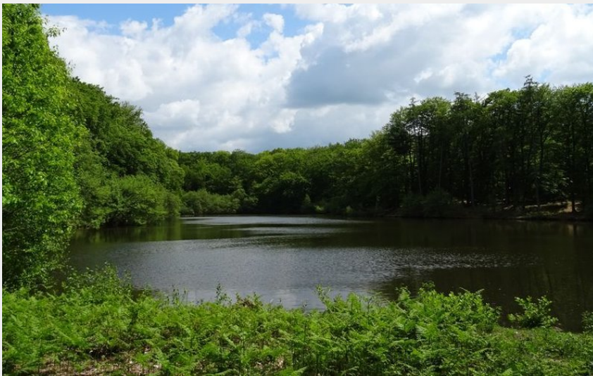
(M. Ildi - Office de tourisme de Noblat)