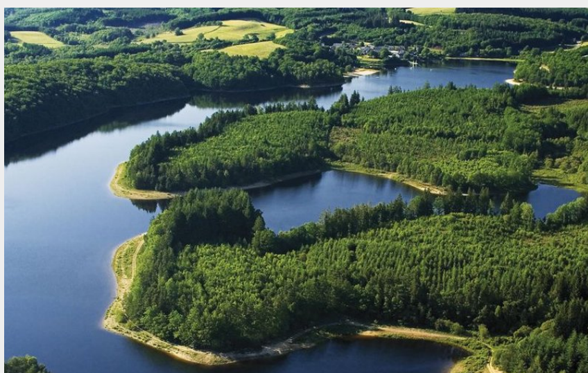
(CRT du Limousin)