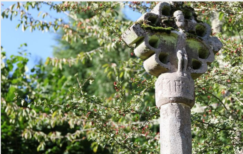
Les Croix de Millevaches (CC HCC)