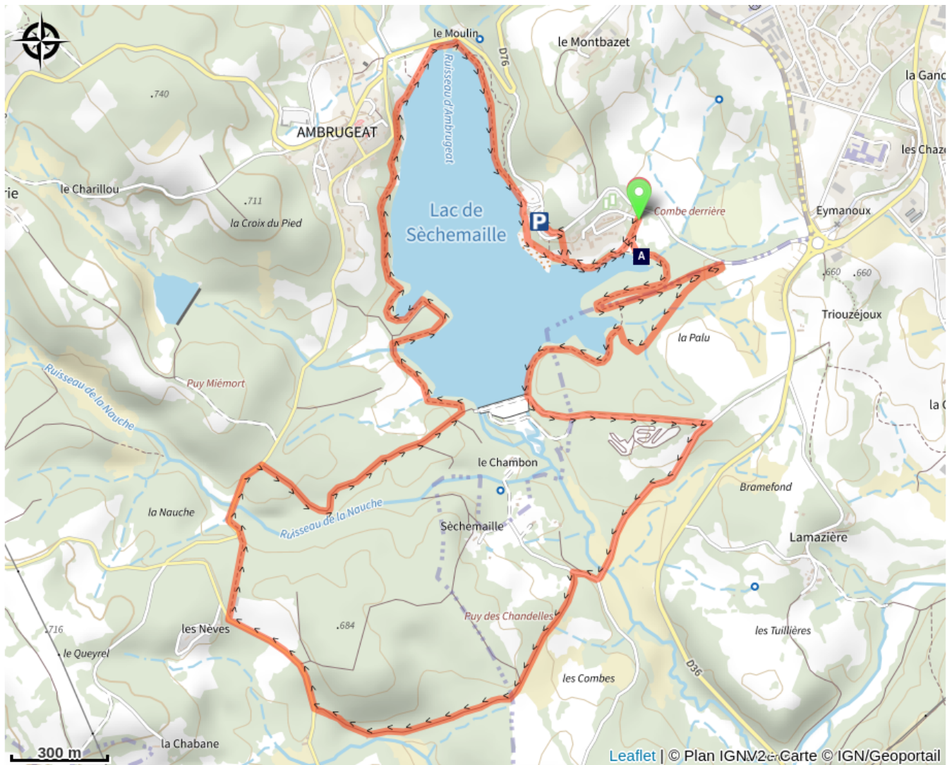
👣 Lac de Sèchemailles (A)