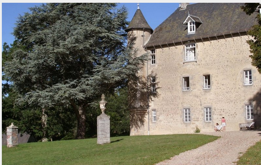
St Agnant près Crocq - Château du Theil (M.Tijeras-Villejoubert (Creuse Tourisme))