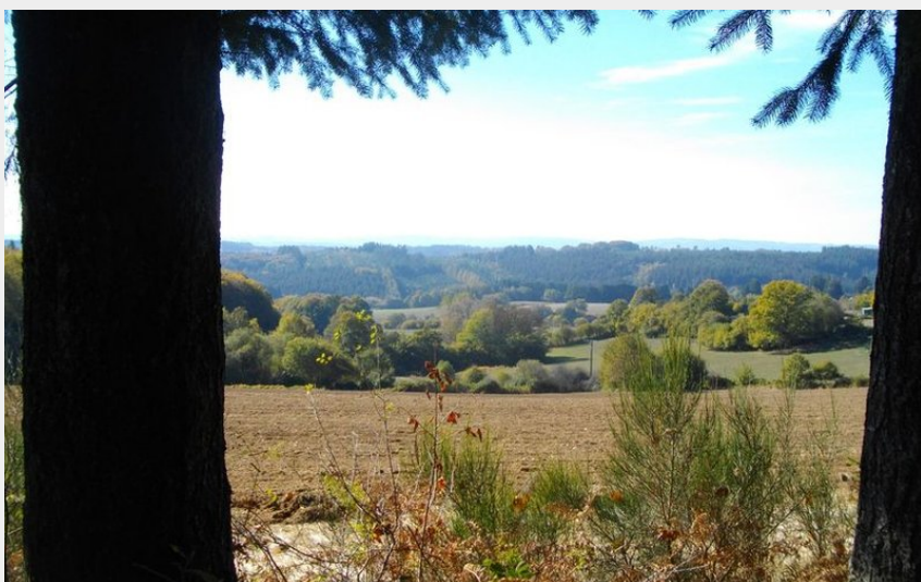
(G.Salat - CC HCC)