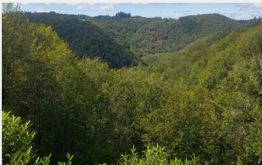
(V.Mendras - CC HCC)